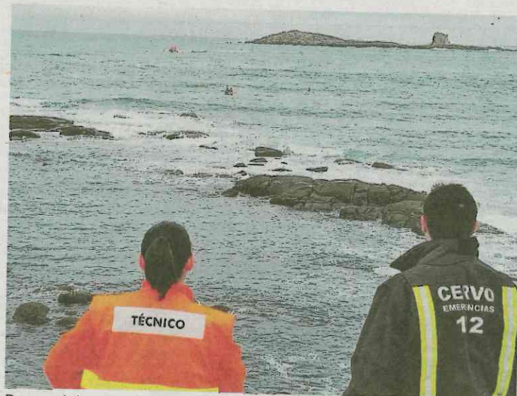
Personal de emergencias observa desde tierra la maniobra de rescate.