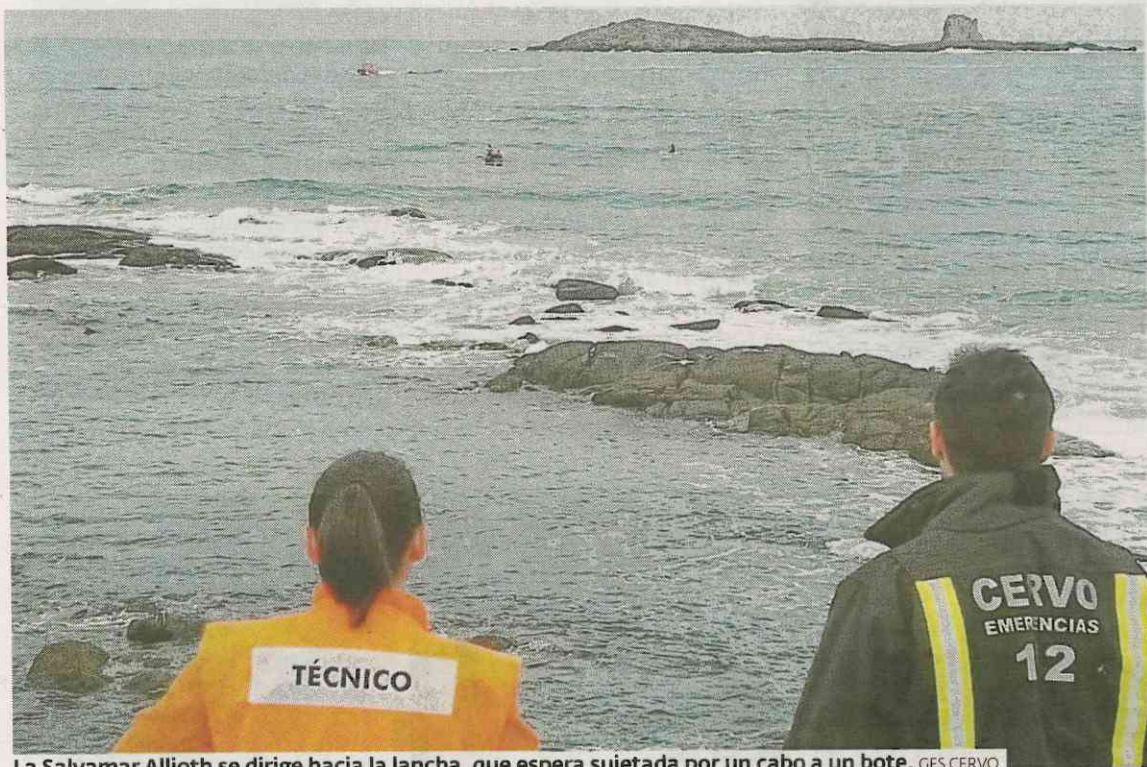
La Salvamar Allioth se dirige hacia la lancha, que espera sujeta a un cabo a un bote. GES CERVO