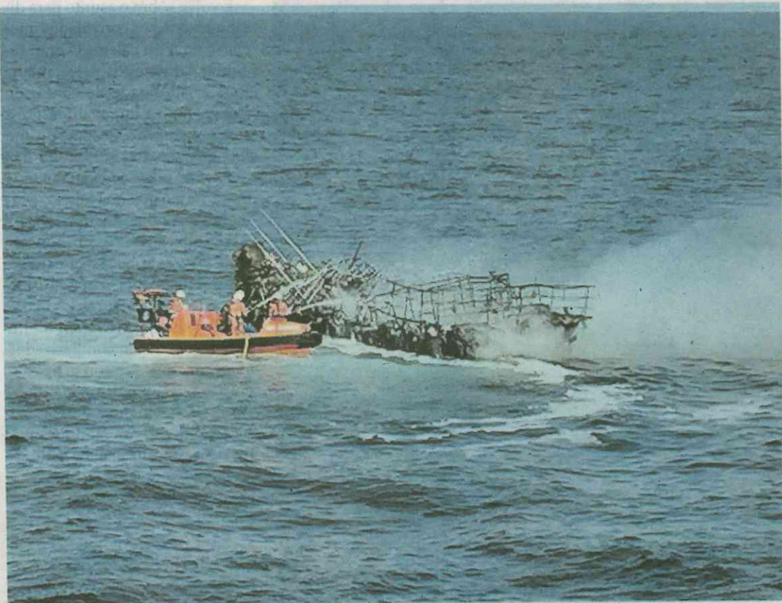
La embarcación auxiliar del Sar Gavia intentó, sin éxito, sofocar las llamas.

El incidente ocurrió pasada la medianoche de ayer. Nada más recibir el aviso, Salvamento Marítimo movilizó al helicóptero Pesca 2, con base en Celeiro. Fueron trasladados a esta localidad de A Mariña, donde todos recibieron atención médica, aunque solo uno de ellos presentaba algún síntoma leve de hipotermia. Tras ser sometidos a una revisión,