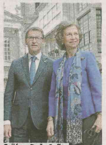
Feijóo y Doña Sofía.

Los partidos viven ya en plena precampaña electoral y disparan con armamento grueso. Es el caso del PP, que ayer denunció a la alcaldesa en el juzgado por el retraso en readjudicar servicios, o del PSOE, que arremete de nuevo contra la gestión sanitaria de la Xunta en Lugo y, en general, sobre su gestión. > 2-3