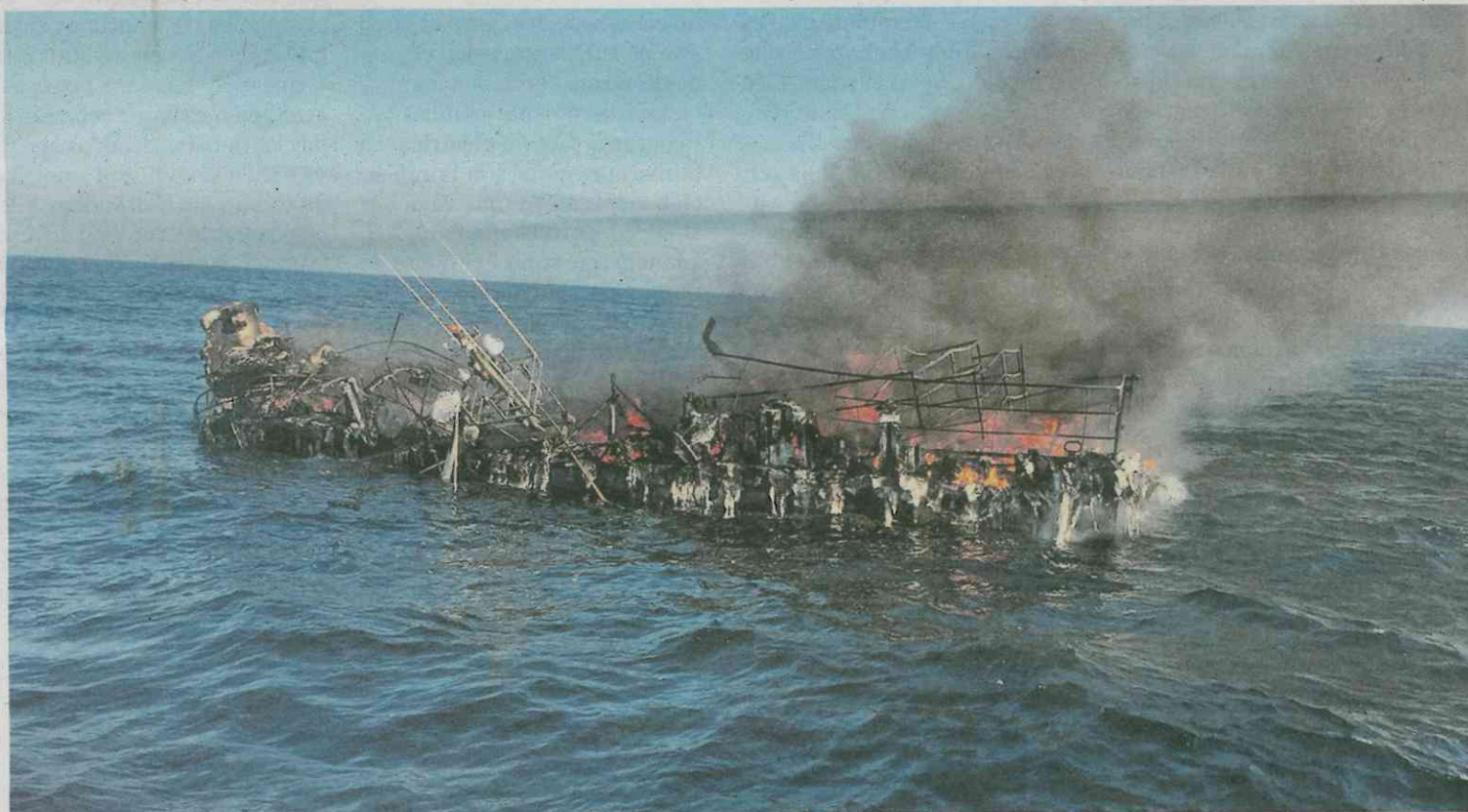
El Roymar, un volantero con base en Laxe, sufrió un incendio y se hundió. Los cinco tripulantes fueron rescatados. SALVAMENTO MARÍTIMO

Los dueños de dos casas de Mondoñedo denuncian que varios menores organizan fiestas en ellas 13