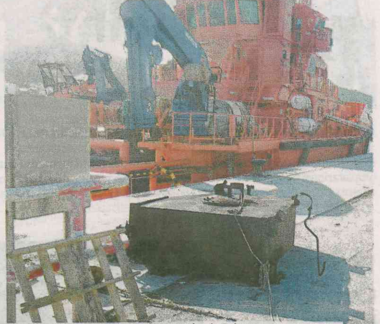
El Roymar, en llamas, poco antes de hundirse al mediodía de ayer. A la derecha, uno de los tanques de combustible metálicos recuperados por el Sar Gavia, de Salvamento.