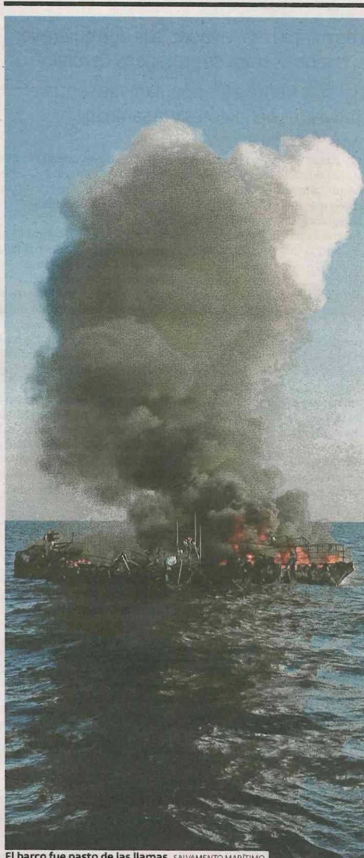
El barco fue pasto de las llamas.