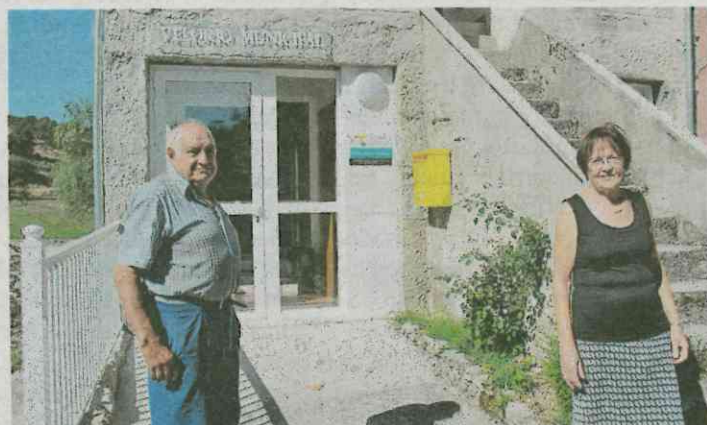
Dos vecinos de Chandrexa de Queixa, ante el velatorio.