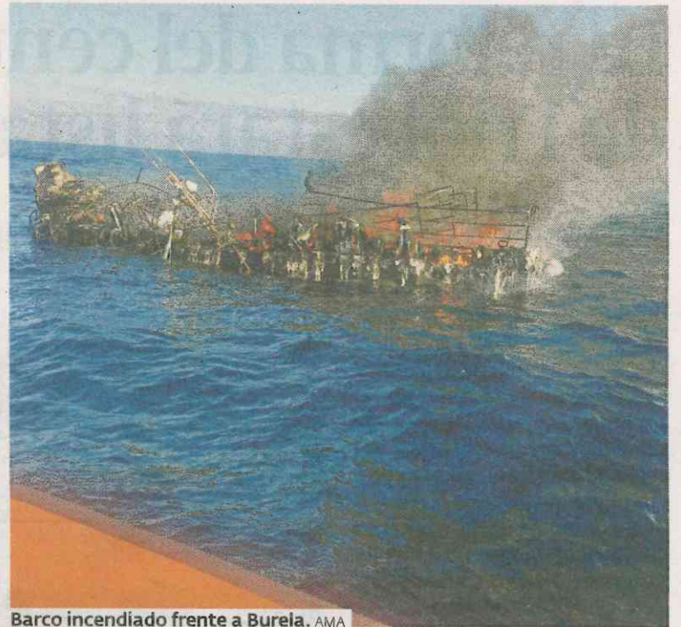
Barco incendiado frente a Burela.

El Centro Zonal de Salvamento Marítimo de Fisterra coordinó el dispositivo de emergencia tras recibir la alerta a las 1.13 de la madrugada. De manera inmediata movilizó al helicóptero de la Xunta, que fue el primero en llegar al lugar del suceso, y a la embarcación Salvamar Allioth, que a primera hora de la mañana comunicaba que el barco seguía en llamas y a flote, por lo que requirió la presencia del Sar Gavia