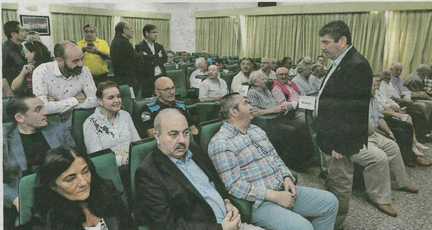
Al acto del 60 aniversario del barco museo asistieron más de una veintena de marineros que formaron parte de la tripulación del buque. X.F.R.