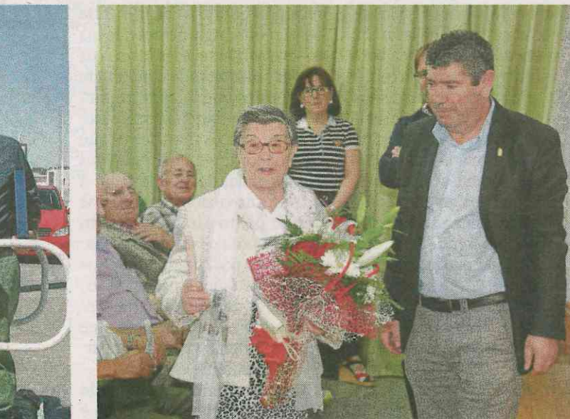
Autoridades y tripulantes (arriba), cuatro marineros de la primera tripulación y degustación en Casa Miranda (centro), los guías y Llano en la entrega de obsequios. IRIA L.V.