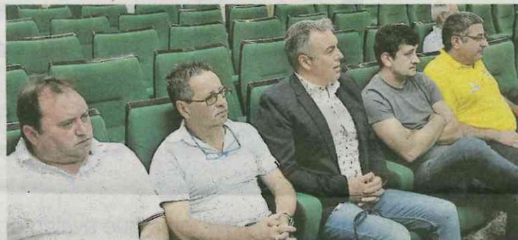
Participaron en el homenaje los guías del barco museo. X.F.R.