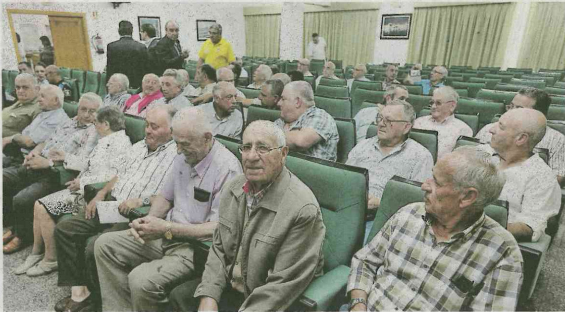
Acudieron más de una veintena de marineros que formaron parte de las tripulaciones del barco.