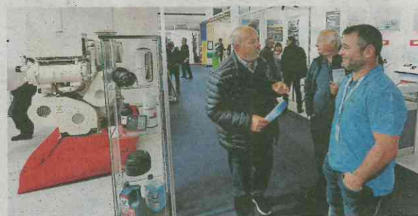
Expomar también es un centro de negocios.