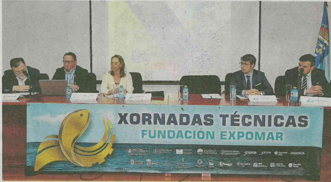
Las Xornadas Técnicas analizaron ayer el aspecto social de la pesca, y hoy, la gestión pesquera. X. F. R.

Expomar se ha ganado a pulso un lugar sobresaliente en el mundo de la pesca gallego, español y europeo. Con la feria bienal como referente, la Fundación que la organiza se esfuerza cada año para que Burela continúe brillando como capital temporal de la pesca. Y ese logro juegan un papel determinante actividades anuales como las Xornadas Técnicas Expomar, que en su veintiséis edición comenzaron el jueves por la tarde y rematan este viernes por la tarde; así como el Encontro de Organizacións Empresariais, que cumple veinte ediciones y tiene lugar este viernes por la mañana. A esos dos cónclaves se les une este viernes un tercero, el pleno del Consello Galego de Pesca, que de modo extraordinario refuerza a Expomar como tambor de resonancia de la realidad del sector.