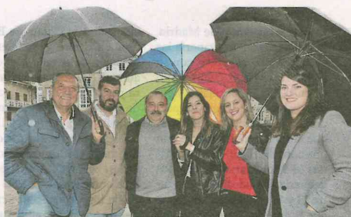
La Voz convocó ayer a los candidatos en el inicio de campaña. P. L.