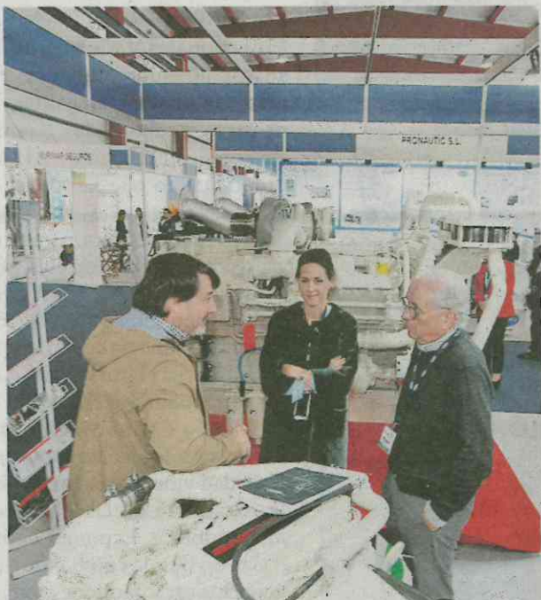
Los motores de barcos siempre llaman la atención.