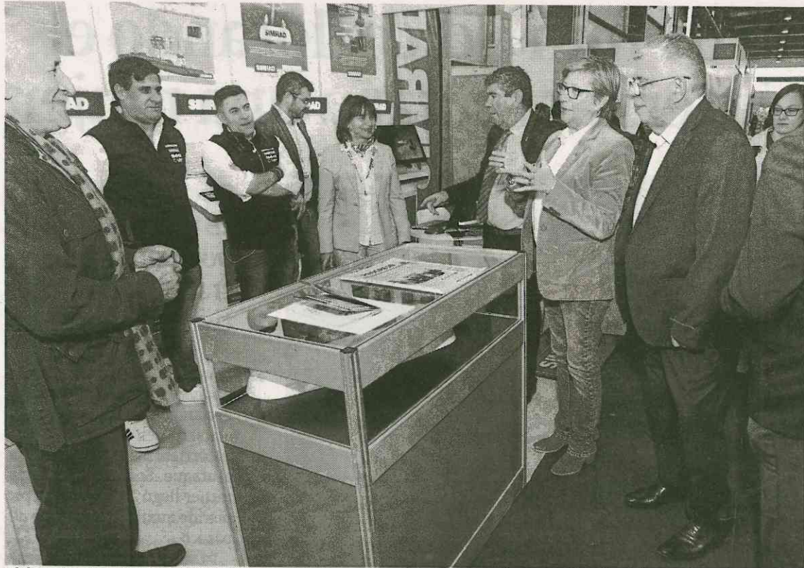
Visita a los stands por parte de las autoridades en el recinto ferial de Expomar (izquierda) y equipos de comunicación en el recinto ferial de la nave de redes. JOSÉ M a ALVEZ