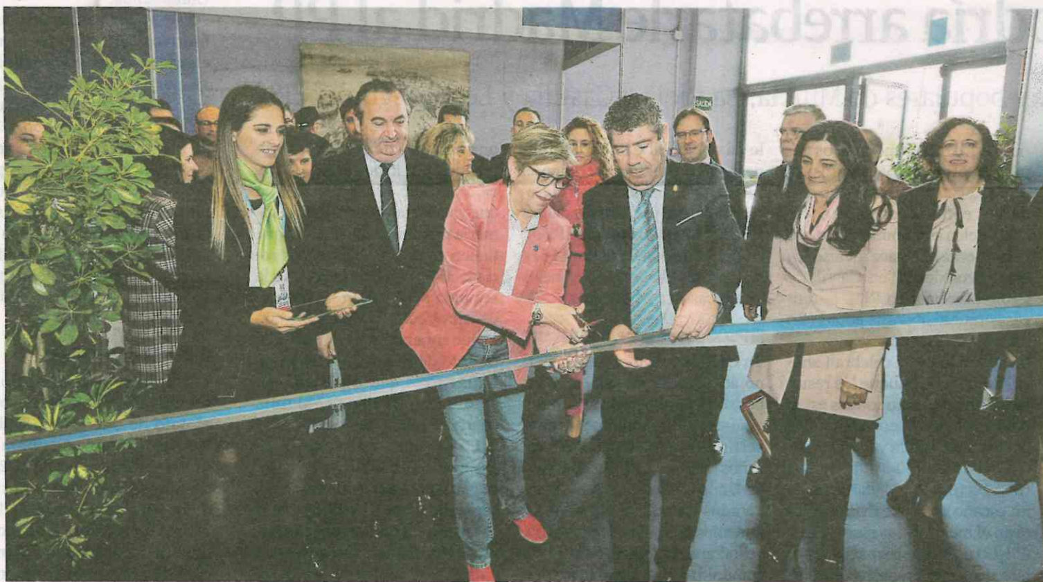
Ayer se inauguró Expomar en Burela, la gran feria del mar, con 350 primeras marcas, y que se celebrará hasta el domingo. X. RAMALLAL

Los días de San José y San Xoán serán festivos en Galicia en 2020