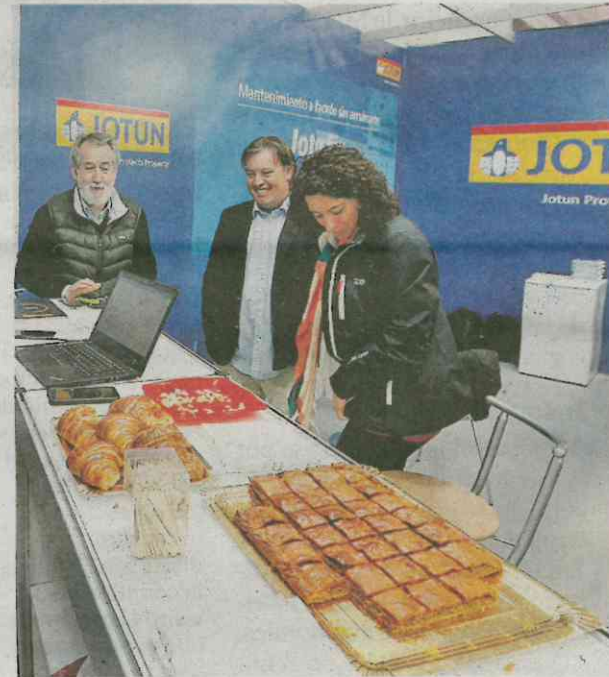
No suele faltar algo para beber o picar en los expositores