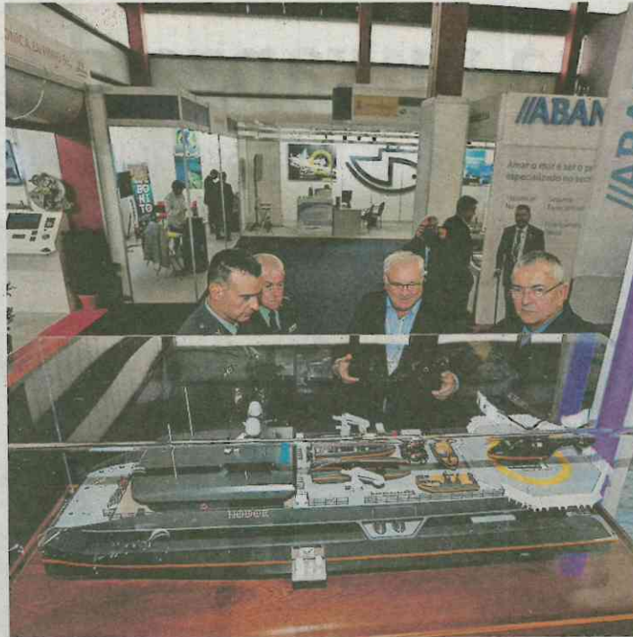
Astilleros Armón muestra maquetas de barcos que ha construido.

Más información en págs. L1 y L3, y en Marítima, pág. 30