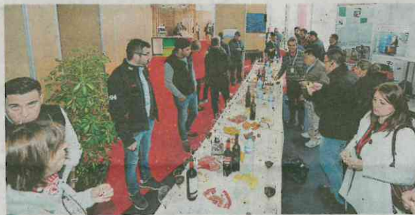
Hay cafetería y degustaciones en el recinto ferial.