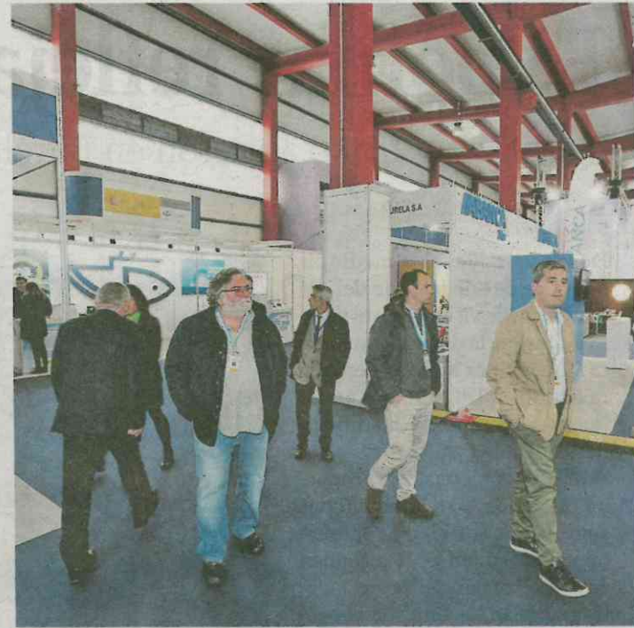
La feria atrae a profesionales y público.