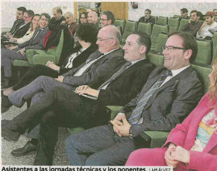
Asistentes a las jornadas técnicas y los ponentes. J.M. ALVEZ

La encuesta realizada afectó a 39 empresas y recogió datos de los años 2017 y 2018 con barcos en los caladeros de Gran Sol, nacional y del Atlántico Norte. El estudio analizó también las remuneraciones y costes salariales. La media