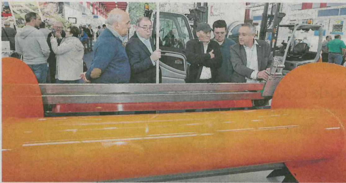
El escaparate de la pesca y la náutica aún puede visitarse hoy, desde las 10 a las 14 horas.