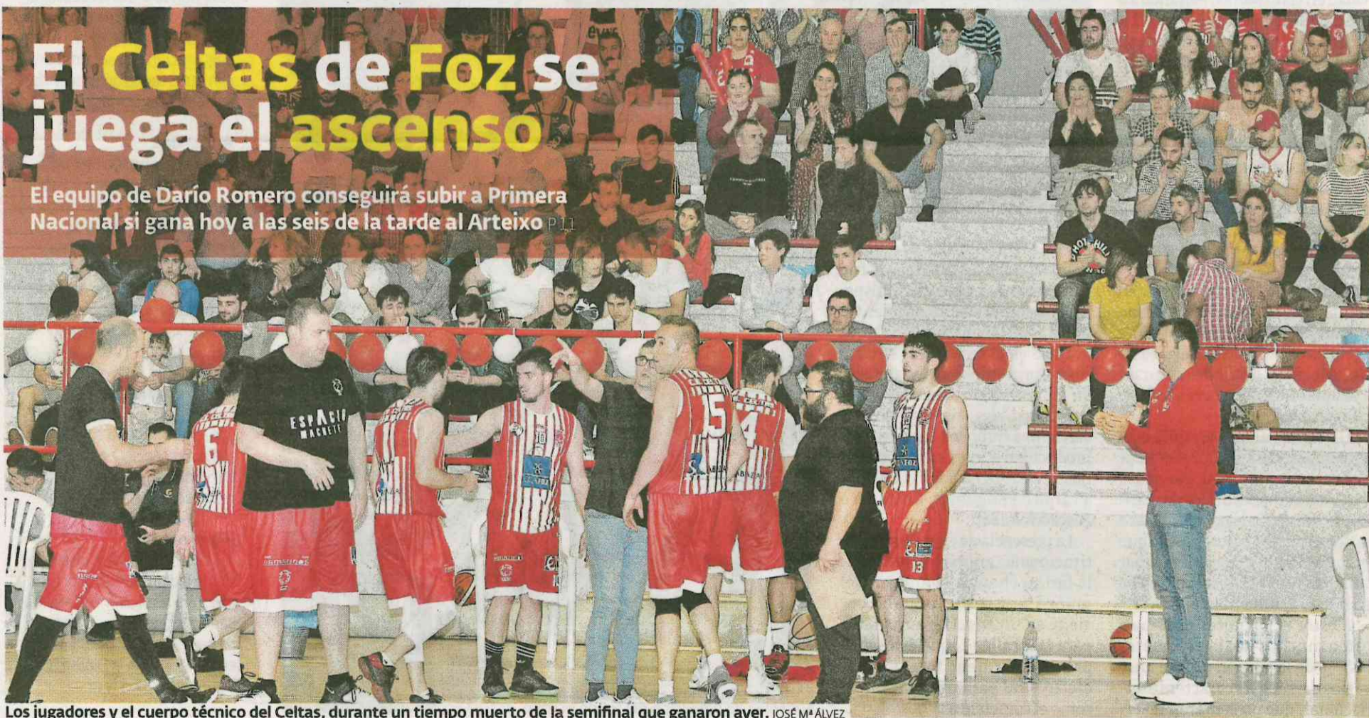
Los jugadores y el cuerpo técnico del Celtas, durante un tiempo muerto de la semifinal que ganaron ayer.