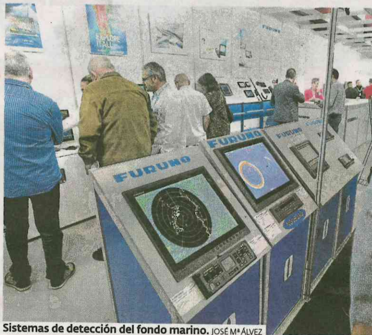
Sistemas de detección del fondo marino. JOSÉ Mª ALVEZ

La presencia de expositores institucionales anima a acercarse a la feria a clientes al margen del mundo de la pesca, lo que la convierte en un atractivo aún mayor para la localidad, que estos días presenta un lleno total y es un efecto vital para otros sectores, como el comercio o la hostelería.