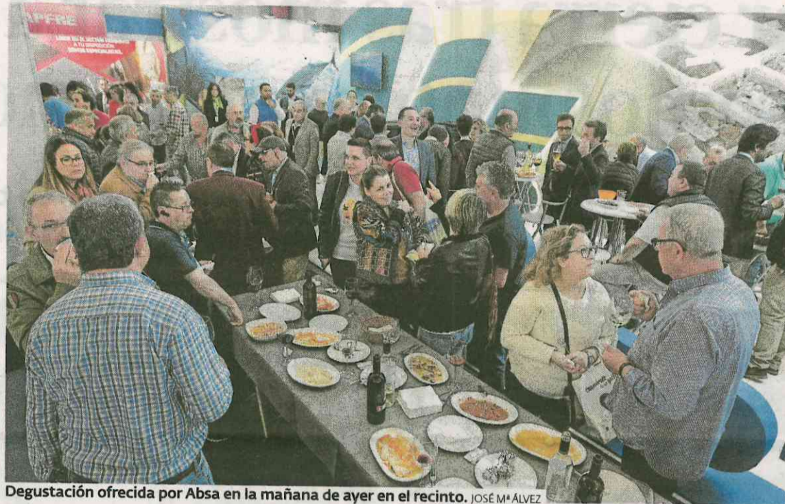
Degustación ofrecida por Absa en la mañana de ayer en el recinto. JOSÉ Mª ALVEZ

A estos expositores se suman otros muchos hasta completar los 130 de la edición de este año, varios de ellos de carácter internacional, que presentaron diver-