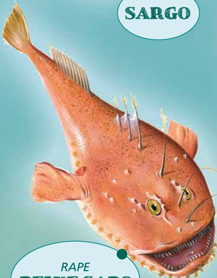
RAPE PEIXE SAPO